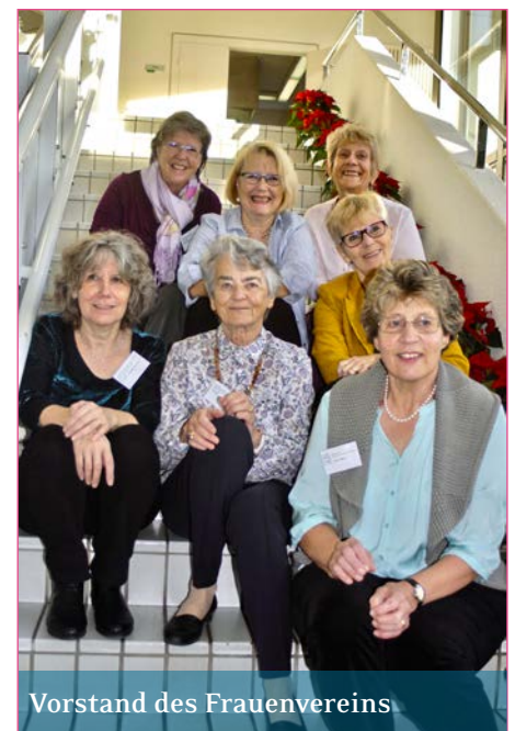
Vorstand des Frauenvereins