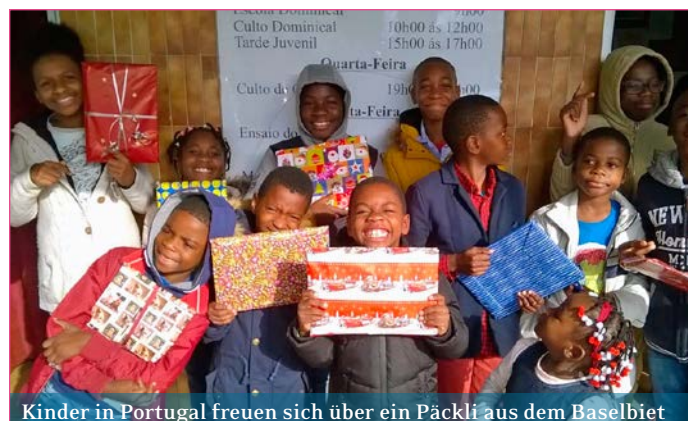
Kinder in Portugal freuen sich über ein Päckli aus dem Baselbiet

Allen Kindern, Eltern und Religionlehrer*innen danken wir herzlich für die fast 200 Weihnachtspäckli, die in Aesch und Pfeffingen mit viel Liebe verpackt und gesendet wurden und nun auf dem Weg zum Weihnachtsfest von Kindern in Portugal und Rumänien sind. Für viele Kinder, die aus sehr armen Verhältnissen stammen, ist dies oft das einzige Weihnachtsgeschenk, das sie erhalten. Umso grösser ist dann die Freude über Schoggi, Farbstifte, Zeichenblock und Kerzli. Manche Kinder haben jeweils auch noch ein Foto und einen persönlichen Weihnachtswunsch beigelegt. Ein schönes Zeichen dafür, die Verbundenheit miteinander auszudrücken. INGA SCHMIDT