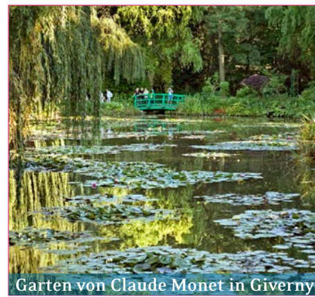
Garten von Claude Monet in Giverny