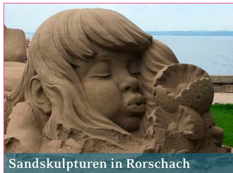
Sandskulpturen in Rorschach

legen Seebad in Romanshorn. Der allseits beliebte Lottomatch rundete die Seniorenferienwoche ab und alle freuen sich auf das nächste Jahr. Wer weiss, vielleicht wieder im Park-Hotel Inseli in Romanshorn. SABINA EICHER