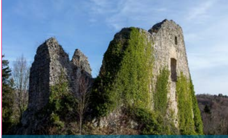
Ruine Löwenburg

Am Freitag, 1. April fahren wir von Laufen mit dem Bus nach Ederswiler / Jurastrasse. Dort beginnt unsere Wanderung über Ruine Löwenburg zum gleichnamigen Hofgut.