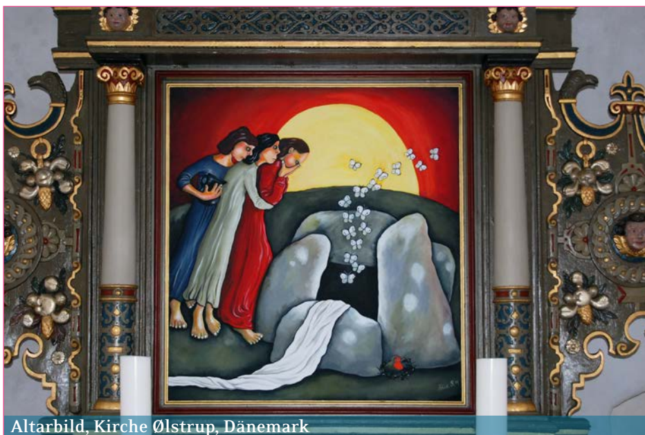
Altarbild, Kirche Ølstrup, Dänemark

men ihre einzigartige Aufgabe wahr, obwohl es sie auf der persönlichen Ebene etwas kostete. Abraham verlor seine Heimat, aber bekam eine neue. Josef verlor seinen Status als Lieblingssohn, aber wurde der zweitmächtigste Mann in ganz Ägypten. Mose verlor die Privilegien eines ägyptischen Prinzen, aber er wurde der Leiter seines Volkes und durfte Wunder erleben. David wurde wegen seiner Ausrüstung ausgelacht, aber besiegte Goliath.