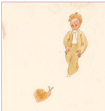
Zeichnungen von Antoine de Saint-Exupéry aus seinem Manuskript von «Le petit prince»

... schreibt Antoine de Saint-Exupéry an einen Freund 1943, im selben Jahr, in dem er das berühmt gewordene Märchen «Der kleine Prinz» verfasst, die Grundlage unseres diesjährigen Weihnachtsspiels. Die leisen Wunder sind für Saint-Exupéry die Sonne, der Mond, die Sterne, die Bäume, die Blumen und die Kinder, vor allem ihr Lächeln.