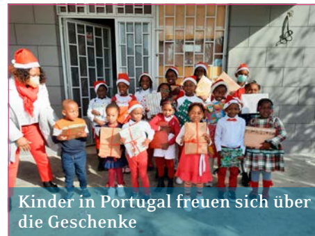
Kinder in Portugal freuen sich über die Geschenke

Allen Kindern, Eltern und Religionslehrpersonen sei herzlich gedankt für die mit Liebe verpackten Weihnachtspäckli, die sie für Kinder in Rumänien und Portugal gespendet haben.