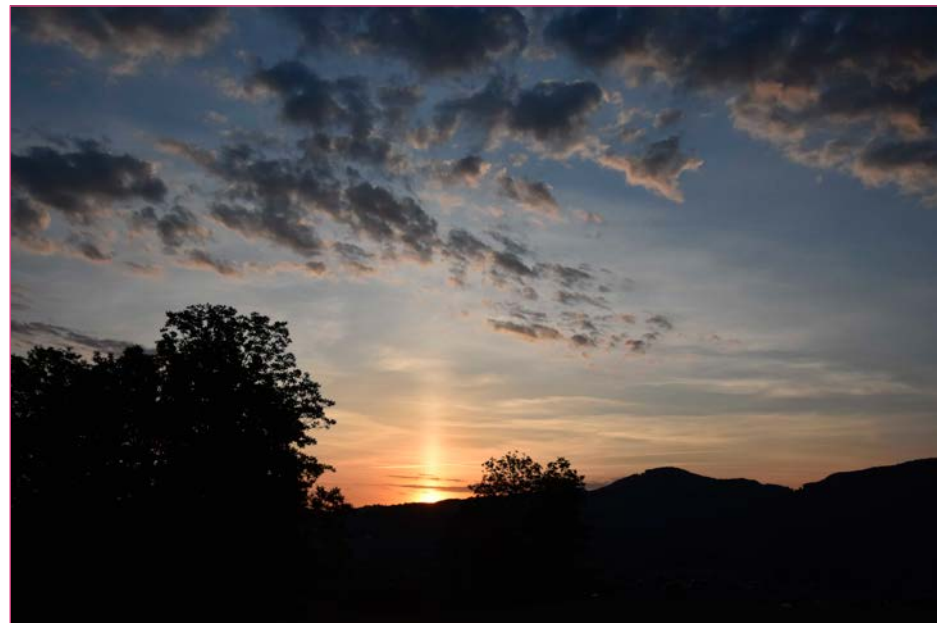
Himmel über Aesch

Und schon stehen wir am Übergang zu einem neuen Jahr und fragen uns: Was wird dieses Jahr 2023 bringen? Finden wir zurück zu einer Normalität? Oder geht der Krisenmodus weiter?