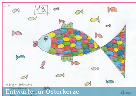
Entwürfe für Osterkerze