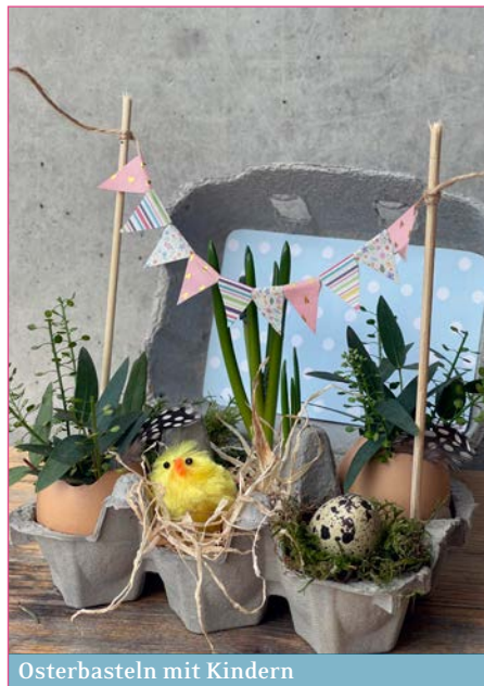
Osterbasteln mit Kindern

CORNELIA IMBODEN UND PIT SCHMIED, RELIGIONSLEHRPERSONEN